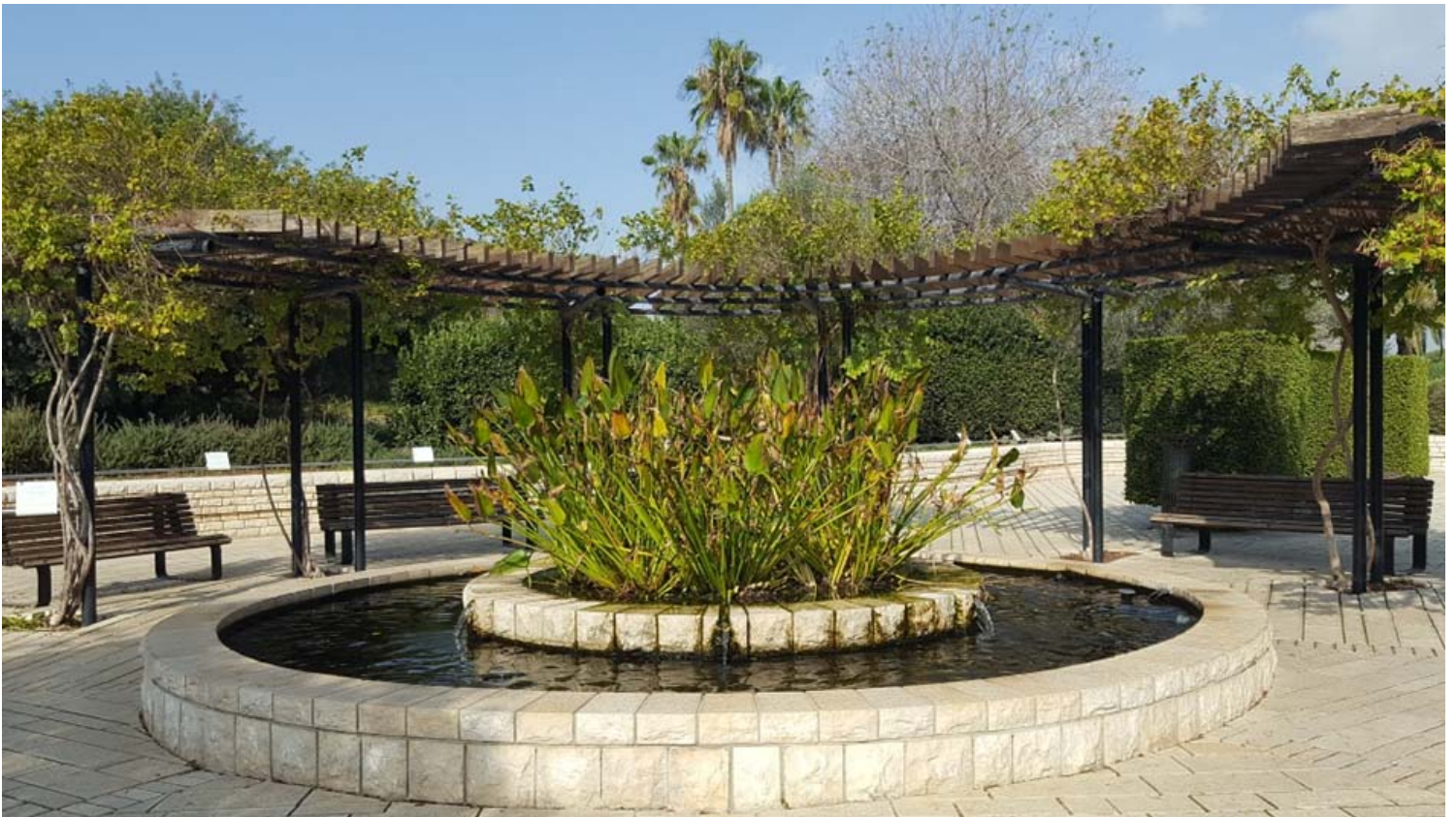
פינת חמד ברמת הנדיב.

ברמת הנדיב ניתן לטייל עצמאית, לרכוב על אופניים בשבילים המסומנים, לערוך פיקניק משפחתי בפינה מיוחדת באתר, וגם לצאת למסע בזמן עם סרטון המוקרן באתר. לאורך המסלול באתר שזורים גנים לפי נושאים: גן המפלים, גן הוורדים, גן הדקלים, גן האירוסים וגן הריחות. הילדים מוזמנים לצייר על כני ציור הפזורים בגנים, להנות מחוברות פעילות, לבקר בגן 'טביעת הרגל', להתבשם מריח משכר של פרחים בגן הריחות ובגן הוורדים וגם להתחרות ב"משחק בריחה" מעניין. לאורך השנה מתקיימות ברמת הנדיב פעילויות חווייתיות לכל המשפחה, למבוגרים ולילדים, סיורים מודרכים, הרצאות, קונצרטים בחודשי הקיץ באמפיתיאטרון, הצגות לילדים ועוד.