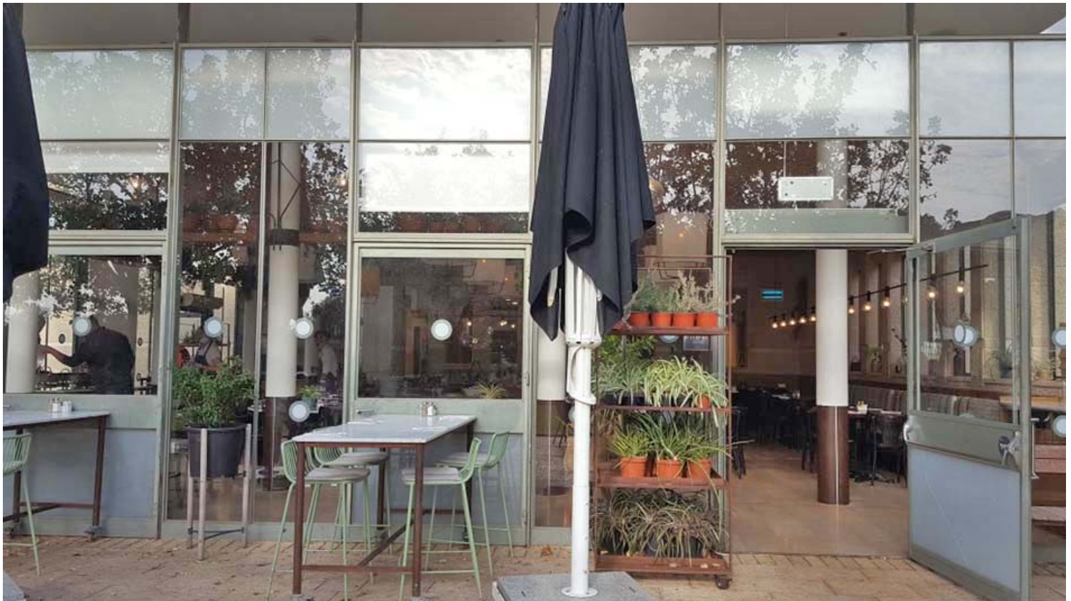
מסעדת מטעים, איכותית וחברתית, ברמת הנדיב.