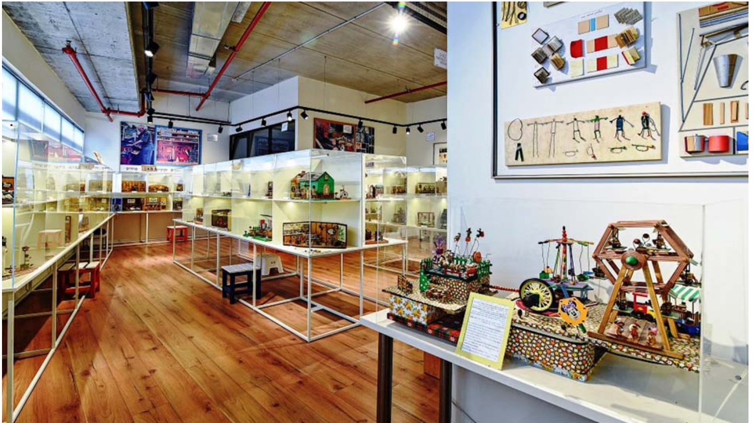
תצפית על המוזיאון.

זמטר שהיה יצירתי במיוחד נהג להשתמש בחומרים ממוחזרים מהטבע ומחוף הים, בגרוטאות, אלטע זאכן, וחומרים מתכלים. צדפים, חלוקי נחל, אבנים, פקקים, פרחי חוביזה, כפתורים, ואפילו פיסטוקים וגרעינים, היוו חומרי גלם לדמויות והדגמים שיצר, והכול בדיוק מירבי, בשימת דגש על הפרטים הקטנים, ובסבלנות אין קץ. כדי ליצור את הדגמים שמחולקים לפני נושאים כמו: בתים שונים, חנויות, דתות, מוזיקה, אמנות וכו', הוא שאב השראה מתמונות, וכן מדמיונו הפורה. הנוסטלגיה היוותה עבורו השראה גדולה כשבנה את דגם כיתתו בגרמניה, או את דגם מטבחה של סבתו. על כל דגם הוא עמל במשך חודשיים, ובשנה היה יוצר בין 6-8 דגמים.