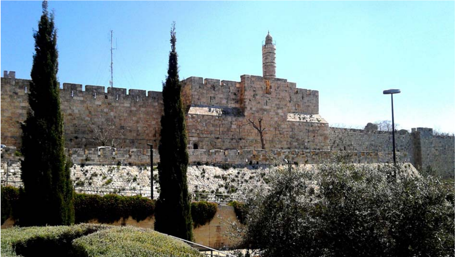
תצפית על מגדל דוד.