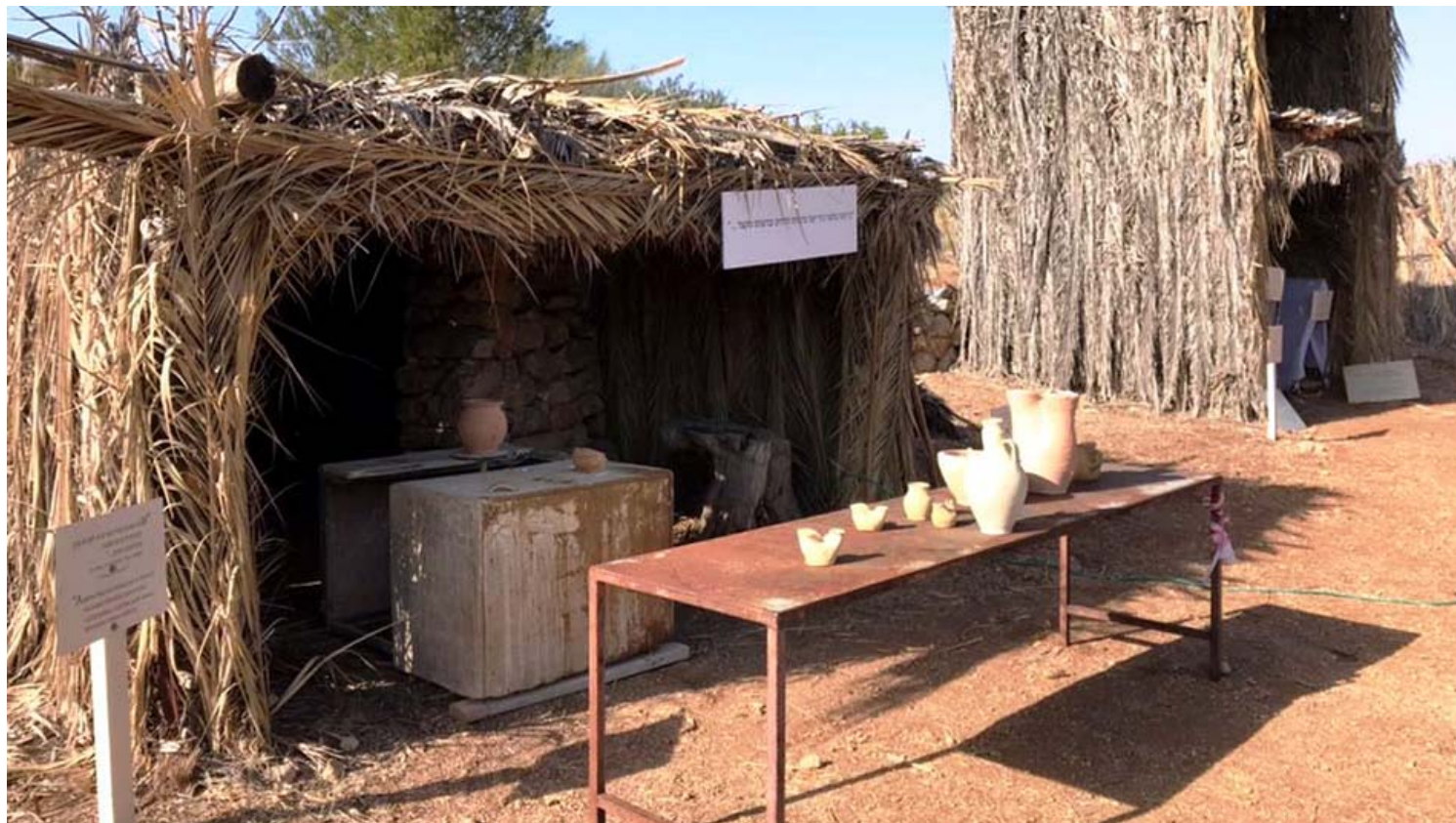
סוכה להשכיר בנאות קדומים. זוה לא הכל:

נקודת הסיום של שני המסלולים היא בתערוכת הסוכות הייחודית, שם מוזמנים המבקרים לפתור כתב חידה ולמצוא את הסוכה המתאימה לכל אורח, מתוך מגוון הסוכות: סוכה על גבי גמל, סוכה עגולה, סוכה על גבי סוכה, סוכה על סירה ועוד יותר מ-20 סוכות בגודל אמיתי המציגות פתרונות יצירתיים ומקוריים למצוות בניית הסוכה.