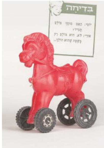
לכל צעצוע יש סיפור: תערוכת צעצועים לכל המשפחה.

מוזיאון יפו העתיקה , הממוקם בכניסה לעיר העתיקה של יפו, שוכן בבית "הסראיה אל-עתיקה" - בית הממשל העות'מאני הישן. המבנה הייחודי מבחינה ארכיטקטונית והיסטורית, נבנה בראשית המאה ה-18 על שרידי מצודה צלבנית, בעל אולמות עמודים ותקרת קמרונים יפיפיה. לאורך השנה מוצגות במוזיאון תערוכות מתחלפות ומתקיימים בו אירועי תרבות ואמנות מובילים.