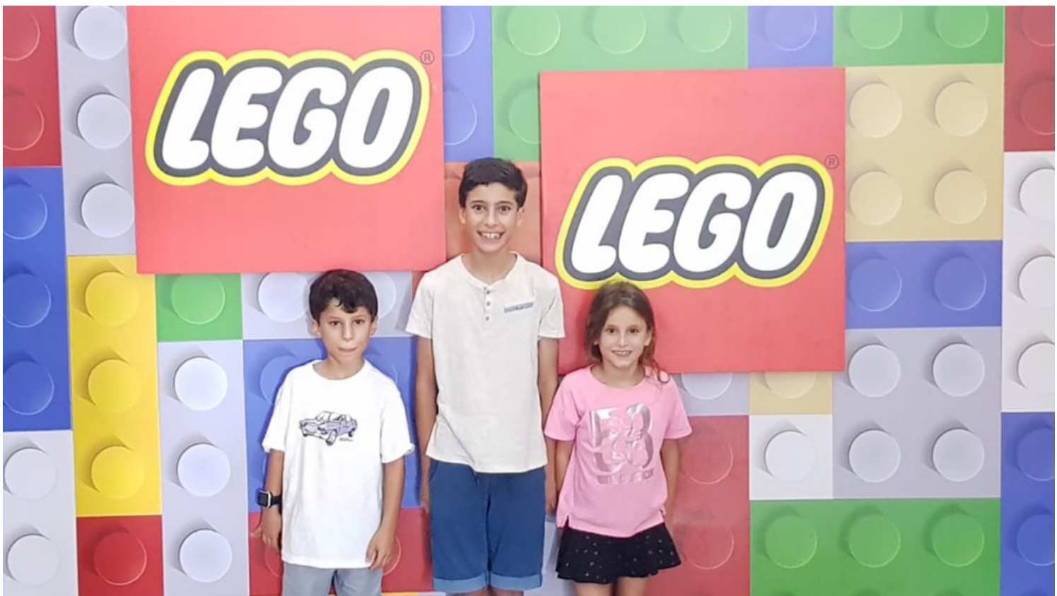
פארק לגו תל אביב. אטרקציות נוספות שמציע הפארק

חלליות שונות. ברחבי המתחם ניצבות בובות של גיבורי לגו, ודמויות LEGO בגודל אנושי שמסתובבות בין המבקרים. הילדים הגדולים או הקטנים האמיצים וההורים שממש רוצים, יכולים ליהנות מקירות טיפוס מגוונים, מתחם אומגה, מתחם מולטימדיה הכולל קונסולות עם כל משחקי גיבורי-על מבית LEGO, מתחם לגו מעוצב עם אביזרים ועמדת ריקוד בהתאם לשירי JUST DANCE ומתחם לייזר אינטראקטיבי המציע תחרות עם רובי לייזר Lego Star Wars בחלל מעוצב.