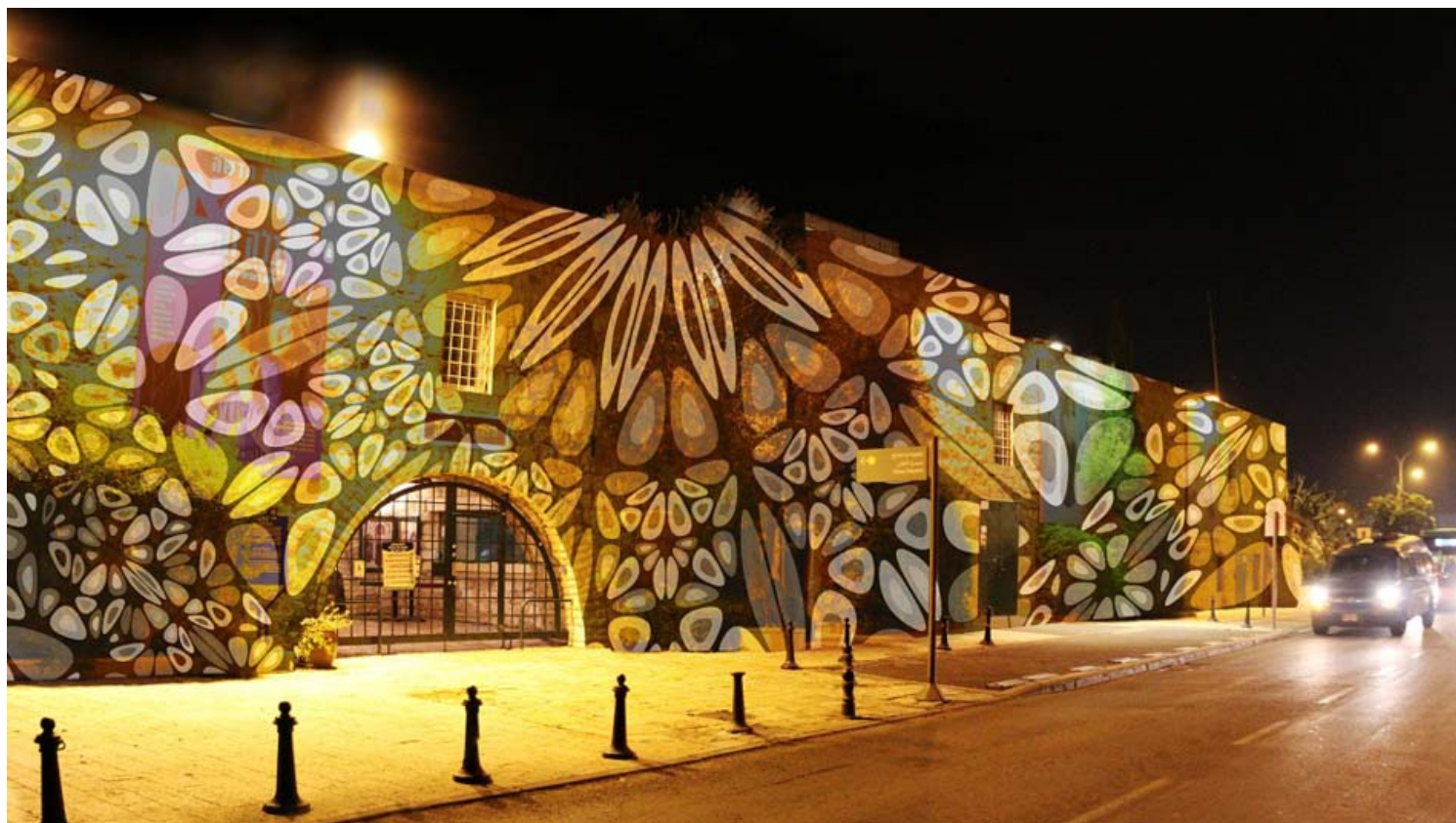
"ירושלים בעקבות האור".