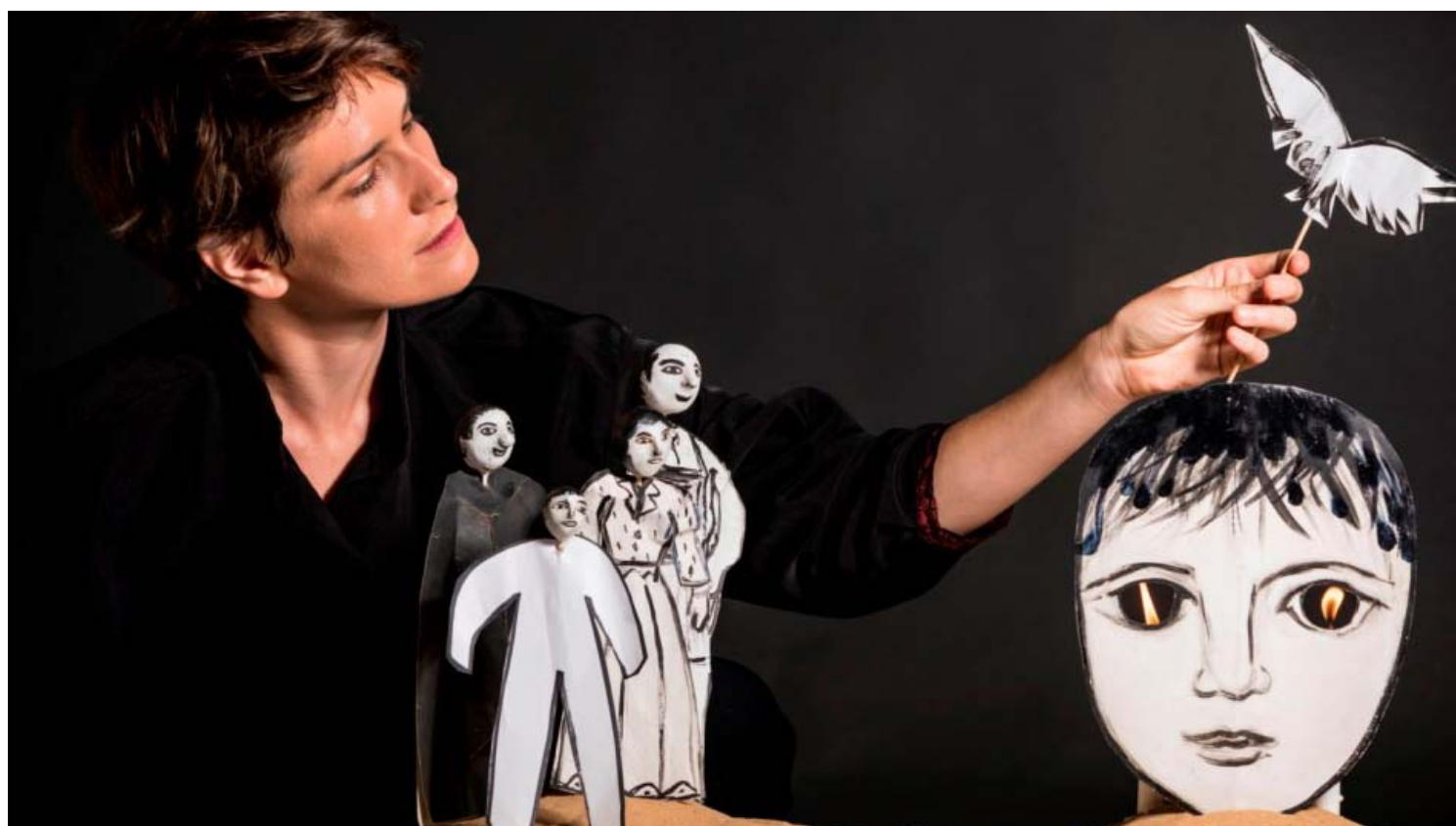
נקודת אור, חנוכה במוז"א.

עלות לילד/ה: 23 ₪ // בין השעות: 10:00 - 13:30