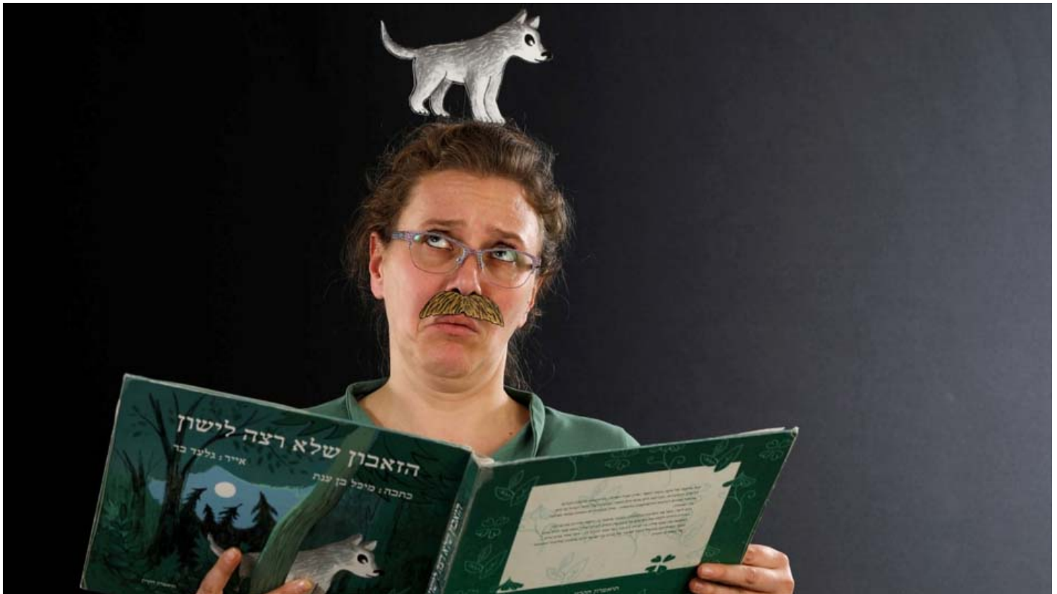
כל המשפחה מצטרפת ל"טיול לילי" במוז"א.