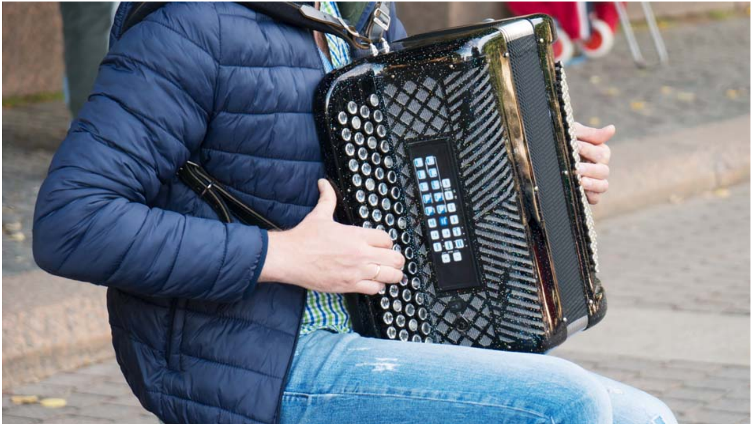
מפגש האקורדיוניסטים של הפירנאים.

בנוסף למוסיקה המתנגנת לאורך כל שעות היום, בערבים מתקיימים מפגשים של מוזיקאים מרחבי העולם. המפגש מסתיים בקונצרט מרשים, הנמשך עד לשעות הבוקר. מומלץ גם לבקר במוזיאון האקורדיון, המציג את תולדותיו של האקורדיון והקשר בין כלי נגינה זה לעם.