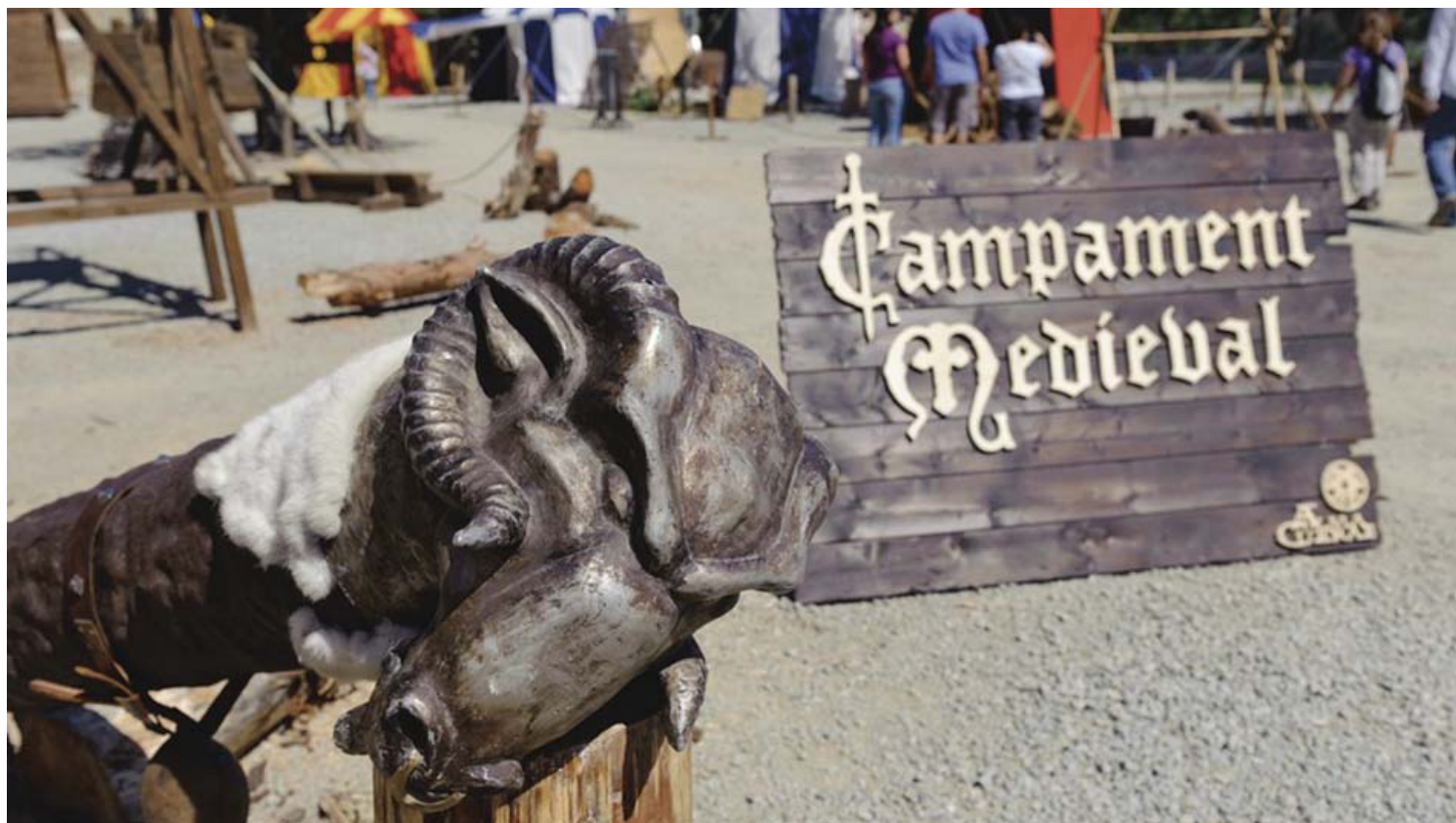
פסטיבל האווירה ההיסטורית.

יש לכם טיפ חשוב נוסף? שאלות מיוחדות? היכנסו לקבוצת הפייסבוק שלנו בלחיצה << טיול משפחתי בארץ ובעולם ותתחילו לשתף!