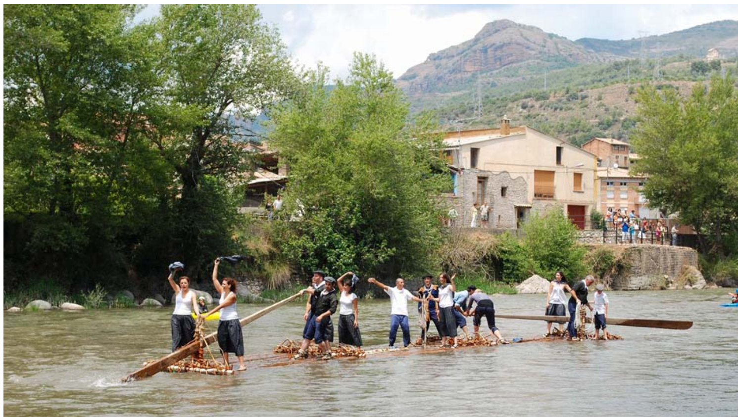
יריד משיטי הרפסודות.

האירוע מתחיל עם ה'ראירים' בתלבושותיהם המסורתיות, וממשיך במשך שלושה ימים בהם נערכים קונצרטים, ארוחות עממיות ומסיבות ריקודים.