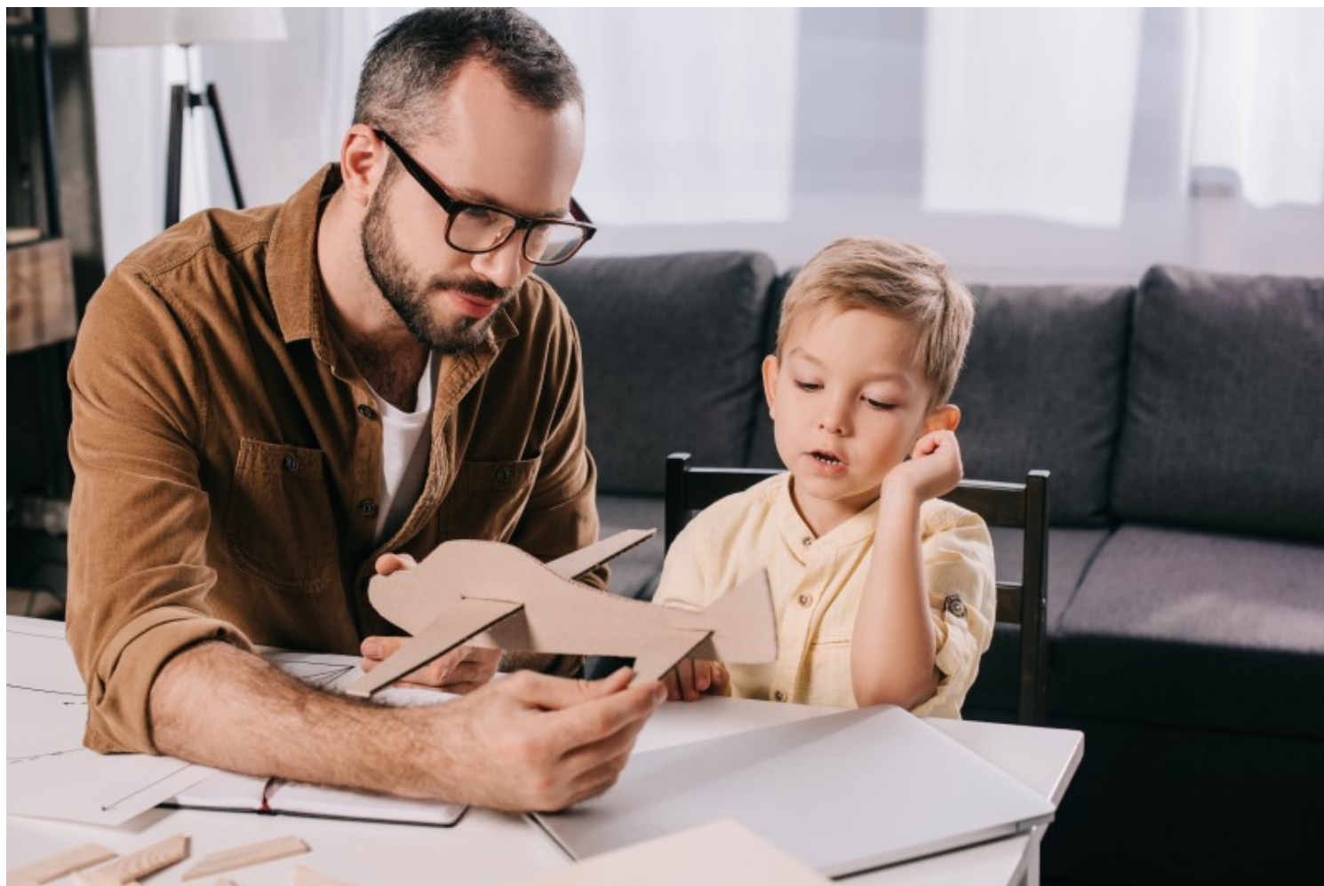
אין כמו להכין משהו יחד.

טיפ קטן וחשוב ☑ השאירו כ-20% מהמוצרים אצלכם. כך תוכלו להציע לילד עוד משחק או צעצוע, כשיסיים את כל מה שבחבילה שלו.