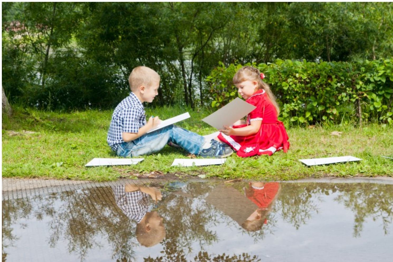
טיול ארוך זה זמן מעולה להתחיל לכתוב יומן.

הציעו לילדים לכתוב או לצייר את החוויות שלהם מהטיול: לכתוב את שמות המקומות בהם הכי נהנו, או של אנשים מיוחדים שהם פגשו, לצייר את הדברים המעניינים שהם ראו ואף להדביק כרטיסי ביקור או מפות שאספו.