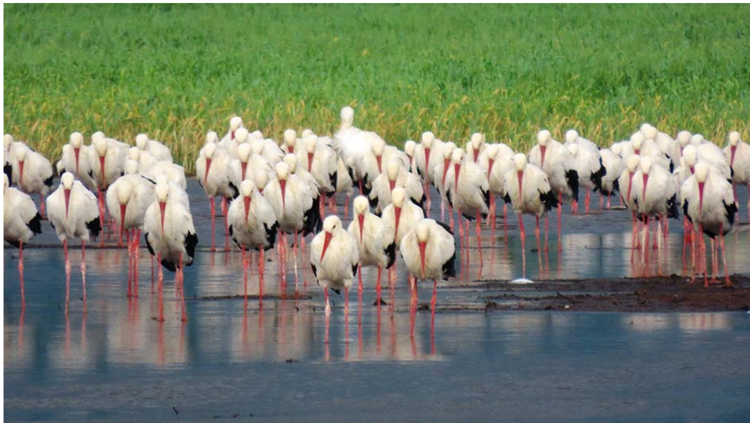
העגורים הגיעו לאגמון החולה. מוזמנים גם לבקר בקבוצת הפייסבוק שלנו 'טיול משפחתי בארץ ובעולם

בשבועות הקרובים צפויים להגיע לאגמון אלפי עגורים בנדידה, חלקם יישאר באגמון כל החורף.